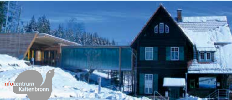
Autor: E. Marek

Infozentrum Kaltenbronn Naturmuseum und Veranstaltungen in der Dauerausstellung und im Auerhahn-Pavillon. Geöffnet: Mittwoch-Sonntag und an allen Feiertagen Tel.: 07224 655197 www.infozentrum-kaltenbronn.de